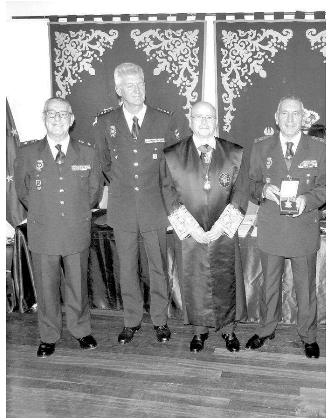
La Jefatura Superior de Policía Nacional recibió la Medalla de Oro del Ilustre Colegio

De igual manera, el Ilustre Colegio de Abogados de Melilla, distinguió a la Jefatura Superior de Policía Nacional con la Medalla de Oro de la institución, por su, según las propias palabras del decano, "defensa y protección de los derechos,