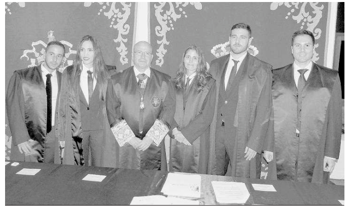
El decano del Colegio de Abogados, junto a los nuevos letrados.