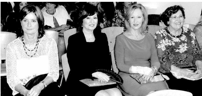
Los familiares acompañaron a los nuevos letrados en la jura o promesa del cargo.